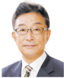
桐生市長 荒木 恵司

桐生には、豊かな自然、趣のあるまち並み、桐生織などの伝統と文化、桐生八木節まつりに見られるような熱気、魅力的な人々と、実に多彩な魅力があります。