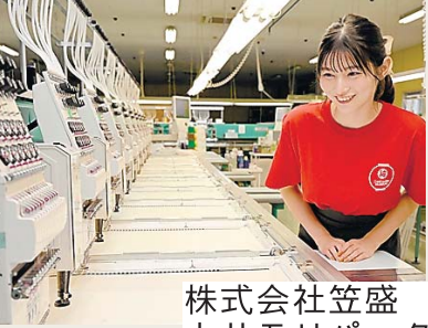
株式会社笠盛 カサモリパーク