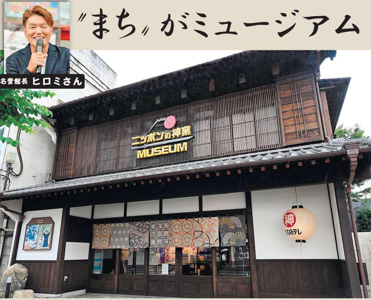
名誉館長 ヒロミさん

【開設期間】 11月6日(日)まで 【場所】 ギャラリー禅林 (本町4丁目、旧山梶商店) 月曜休館(祝日の場合は翌日) ※10月24日(月)は除く