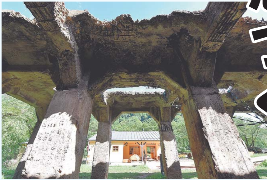
復元された旧太子駅舎(昭和20年代の駅舎。背後には鉄鉱石を積み込む施設「ポッパ」がそびえる)