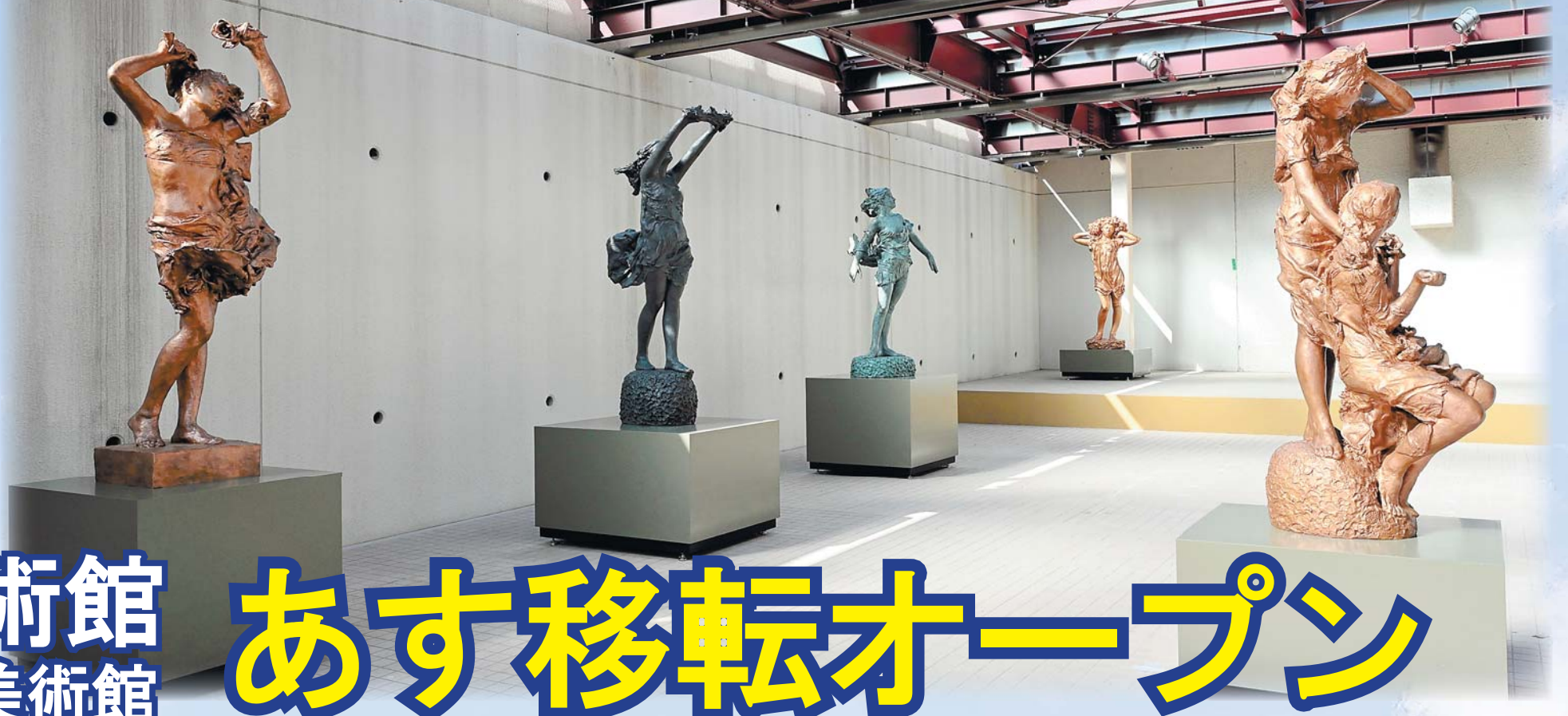
自然光が差し込む常設展示室

気軽に立ち寄れる街中の美術館として親しまれてきた渋川市美術館・桑原巨守彫刻美術館が、あす3月3日、市役所第二庁舎に移転オープンする。新しいコンセプトは「つながりひろがる あおぞら美術館」。市全体を垣根のない「あおぞら」に見立て、人と芸術、文化、地域などをつなぐ拠点を目指す。