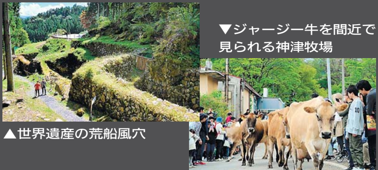
▲世界遺産の荒船風穴

下仁田 荒船の湯 電話 0274-67-5577 mail info@arafunenoyu.com 所在地 下仁田町大字南野牧9326-1 営業時間 10:00~20:00(最終入館19:30) ※現在、時間を短縮して営業