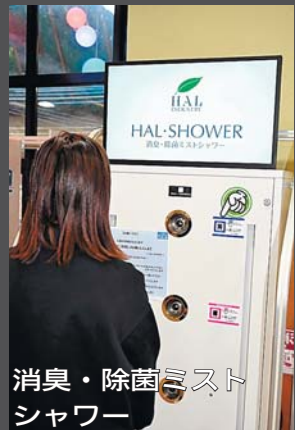
消臭・除菌ミストシャワー