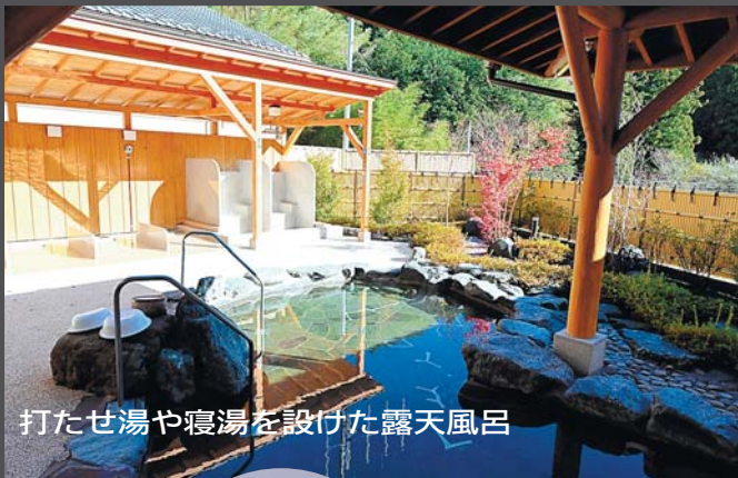
打たせ湯や寝湯を設けた露天風呂

下仁田町で、民間企業のノウハウやアイデアを活用し、まちづくりが進んでいる。建設会社に譲渡後、昨年10月にリニューアルオープンした日帰り温泉施設「下仁田 荒船の湯」もその一つ。新たな温泉設備を追加し、飲食メニューも一新する一方、コワーキングスペースも設け、利用者増に知恵を絞っている。町はガス事業も民間譲渡しているほか、チャレンジショップや起業支援補助金制度を活用した新規開業が相次ぐなど、民間活力による地方創生が進行中だ。