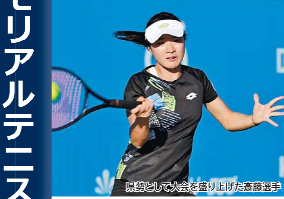
清水善造メモリアルテニスコート