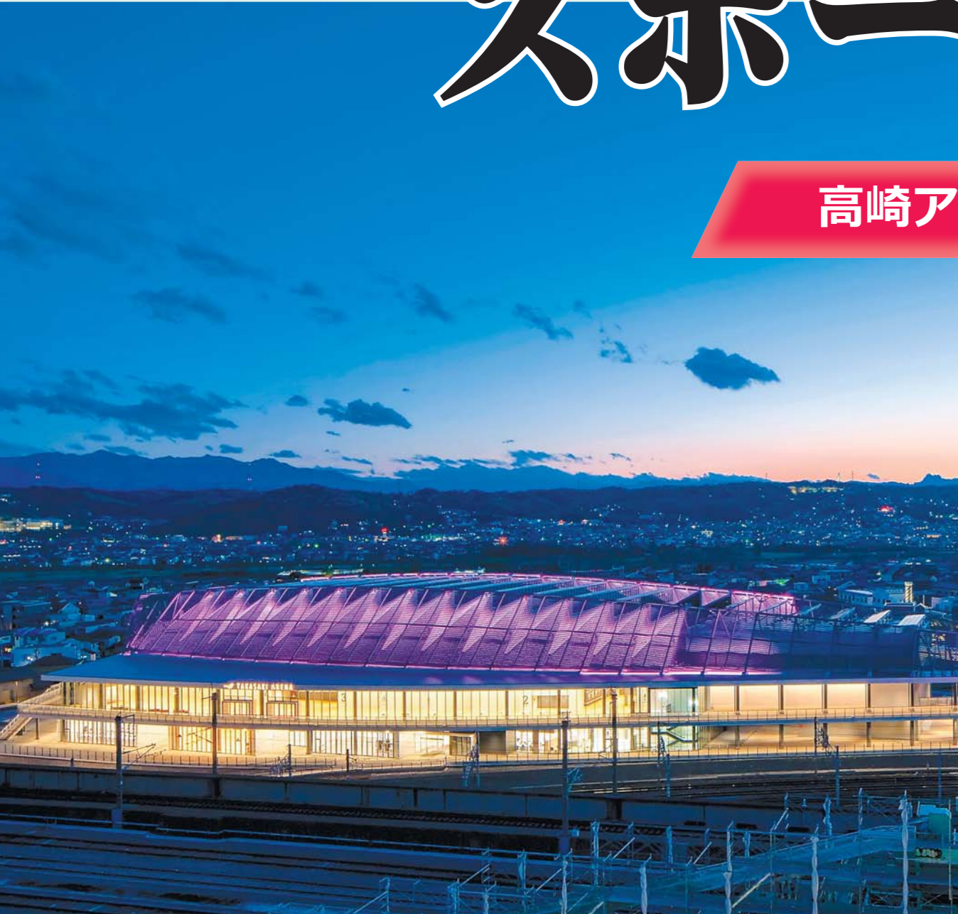
五輪選手も熱戦 トップレベルの大会続々

選考会を兼ねたNHK杯を開催。パリの地から日本中を熱狂させた選手たちが高崎で激しい代表争いを演じた。11月には柔道の講道館杯全日本体重別選手権が開催され、12月以降もフェンシング男子フルールの高円宮杯ワールドカップなど大規模な大会がめじろ押しだ。東京五輪の際はポーランド男子バレーボールやイスラエル新体操の選手団が事前合宿地として活用した。ロシアの軍事侵攻を受けるウクライナの新体操選手団も2022年から受け入れ、来年1月からは4度目を予定している。