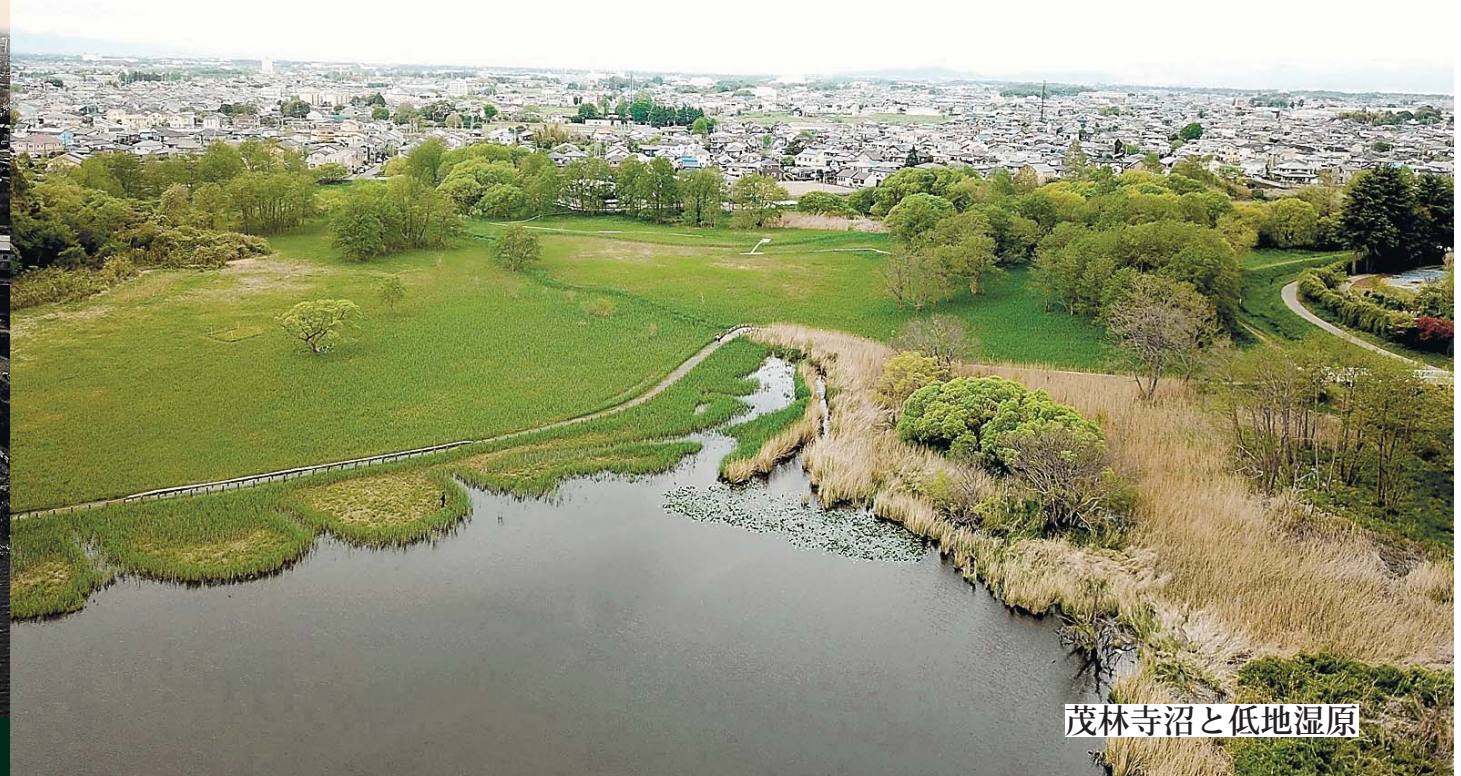
茂林寺沼と低地湿原